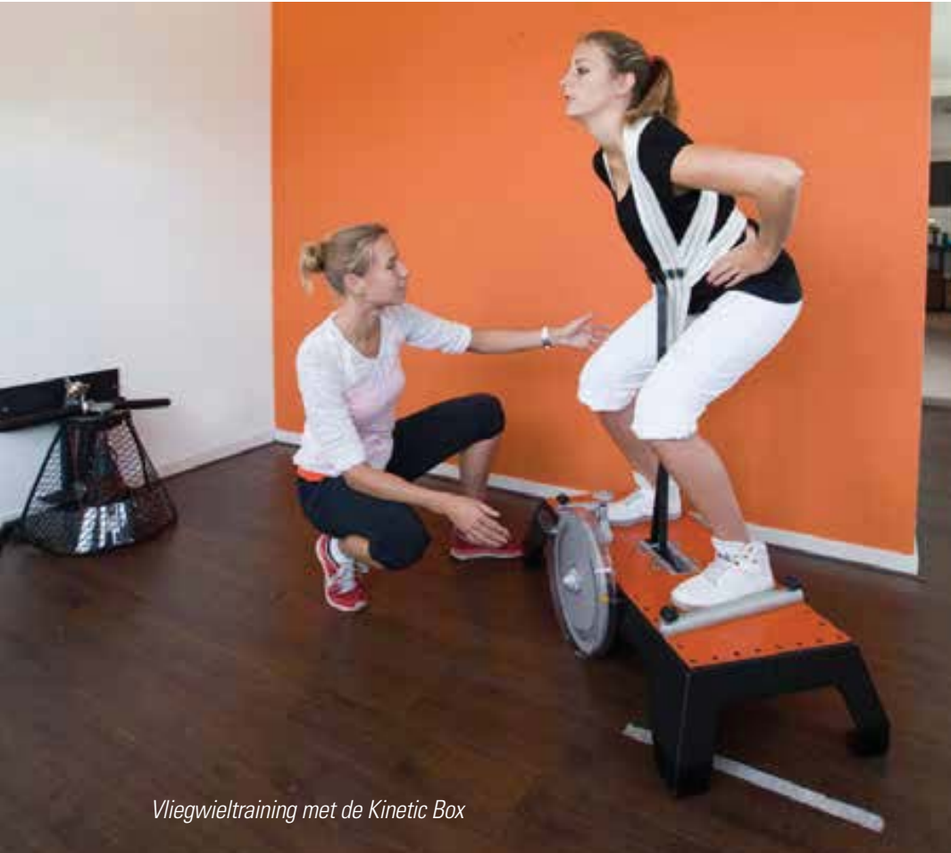
Vliegwielttraining met de Kinetic Box